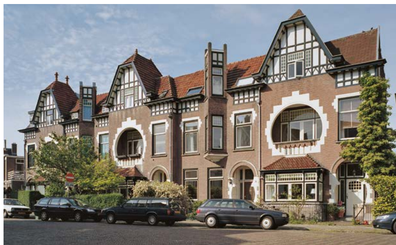
Herenhuizen, Wilhelminapark 18-22, in Haarlem. C.S. Booms 2005